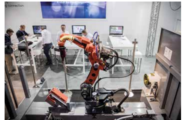
De plattegrondindeling is dit jaar aangepast, zodat segmenten zoals automatisering, plaatbewerking, verspaning, 3D-printen, reiniging/oppervlakte en verbinden geclusterd op één plaats zijn te vinden.

Permacol, Lubribond, BNS Industrial, Delta Application Technics, Adhesive Bonding Center en het Nederlands Instituut voor Lastechniek (NIL) bezoekers op het demoplein bezoekers informeren over de mogelijkheden van de verschillende lijmtechnieken. “Lijmtechniek wordt steeds vaker toegepast, maar er is nog veel onwetendheid over de verbindingstechniek. Op het Demoplein verbindingstechniek willen we bezoekers informeren over alle nieuwe ontwikkelingen binnen dit vakgebied. Lijmproducenten demonstreren er toepassingen van lijmproducten en -technieken, en maken de voordelen van lijmtechniek ten opzichte van lastechniek duidelijk.”