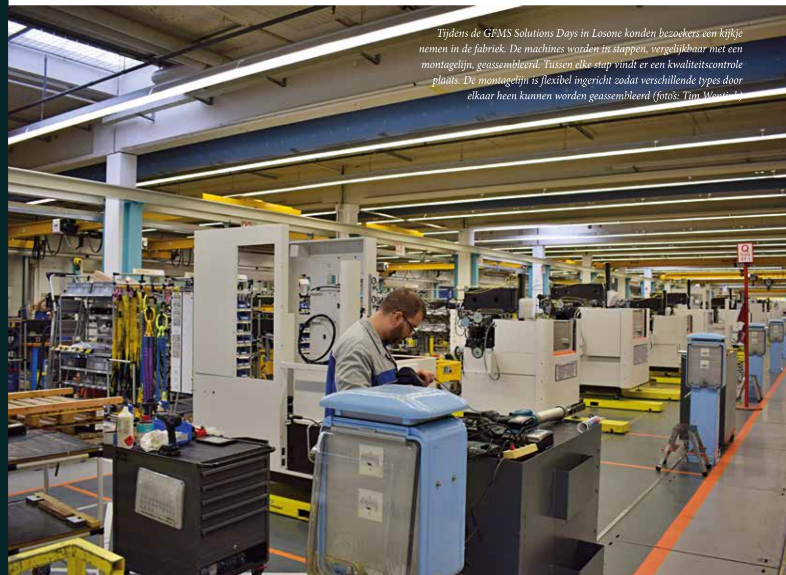
Tijdens de GFMS Solutions Days in Losone konden bezoekers een kijkje nemen in de fabriek. De machines worden in stappen, vergelijkbaar met een montagelij, geassembleerd. Tussen elke stap vindt er een kwaliteitscontrole plaats. De montagelij is flexibel ingericht zodat verschillende types door elkaar heen kunnen worden geassembleerd

Tijdens de Solutions Days in het Zwitserse Losone begin april introduceerde GF Machining Solutions (GFMS) de Spark Track, een interessante functie waarmee bij het draadvonken in real-time bepaald kan worden waar de vonkoverslag plaatsvindt. Dit voorkomt draadbreek bij onderbroken sneden. Daarnaast werd een nieuwe lasermachine gepresenteerd voor het aanbrengen van texturen en kon men een kijkje nemen in de fabriek, waar sinds kort ook 3D-metaalprinters worden gebouwd.